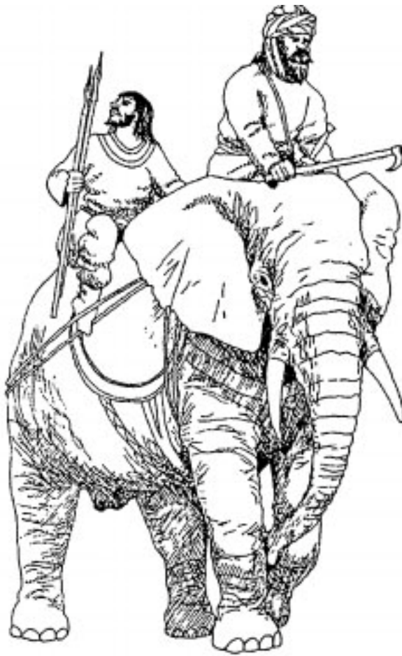
Съвременна възстановка на сасанидски воители върху боен слон